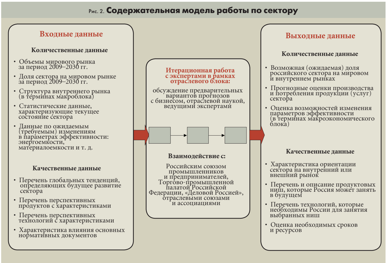
Рис. 2. Содержательная модель работы по сектору

состоянию на середину 2008 г. является тот факт, что многие компании имели планы по технологической модернизации; для определения оптимальных стратегий и вариантов такой модернизации привлекались специализированные организации и проводился технологический аудит. Однако представители деловых кругов не всегда способны оценить эффекты от внедрения новых технологий, что, вероятно, говорит об отсутствии детальной проработки различных вариантов технологических решений. Многие респонденты в ходе углубленных интервью не смогли рассказать о существующих технологических развилках и ключевых проблемах компаний. Это, в свою очередь, свидетельствует о спорадическом характере инновационного процесса в компаниях. Наконец, сравнительно невелика доля предприятий, собирающихся менять базовые технологии производства, так как подавляющему большинству они позволяют производить конкурентоспособную продукцию (по крайней мере, в среднесрочной перспективе). Подобная консервация представляет собой скрытую угрозу: замена на аналогичное оборудование может означать сохранение отставания на один или даже два технологических уклада еще на пять–семь лет. Все вышеперечисленное еще раз подчеркивает важность участия бизнес-сообщества в принятии решений о технологическом облике сектора, с тем чтобы из игрока, потребляющего результаты исследований и разработок (ИиР), оно превратилось в формирующего спрос на них.